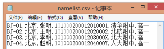
图 2. 选手名单示例

特别注意: “_” 与 “-”、大小写字母的区别, 编号不得出现空格 (包括前后)。